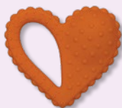
Anillo de dentición de corazón