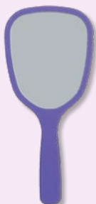
Mi primer espejo