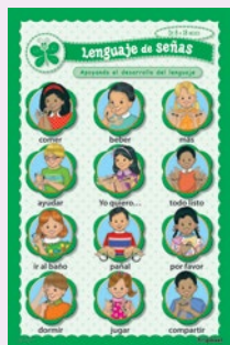
Cartel de lenguaje de señas