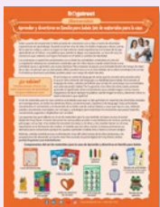
Carta de bienvenida