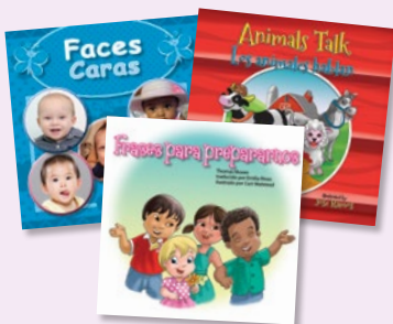
3 libros de cartón