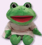
La ranita Lily